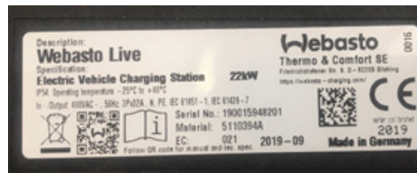
Abb. 01: Typenschild: Seriennummer und QR-Code