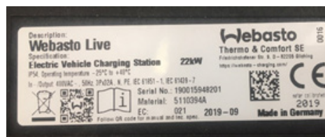
Fig. 03: Type label: Serial no. and QR-code

The „Firmware successfully updated“ advisory text is displayed in the configuration menu after a successful update. You can start charging with your updated charging station.